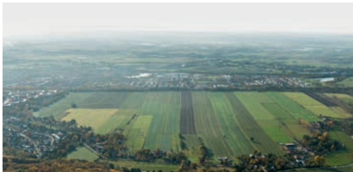
Areal des künftigen Stadtteils Oberbillwerder aus der Luft