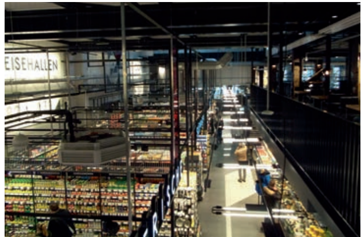
Oben: ehemalige Firmenzentrale Claudius Peters AG; oben rechts: ehemalige Oberpostdirektion; unten rechts: Rewe Supermarkt in den Zeisehallen