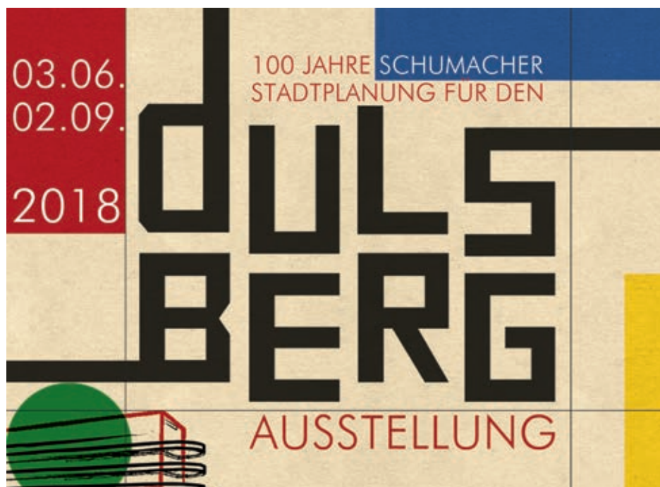
Offizielles Plakat zum Jubiläum

Verbindendes Element war roter Backstein, der bis heute das dominierende Gestaltungselement auf dem Dulsberg ist. Der Grünzug, der vom damaligen Gartenbaudirektor Otto Linne entworfen und zu großen Teilen realisiert wurde, erhielt verschiedene Spiel- und Ruhezone für Jung bis Alt. Trotz vieler Veränderungen, insbesondere infolge von Krieg und Wiederaufbau, ist die Grundkonzeption von Fritz Schumacher bis heute ablesbar. Ihr Zusammenspiel aus Gebäuden und Freiräumen ist nach wie vor von hoher städtebaulicher Qualität und macht den Dulsberg zu einem bauhistorisch wertvollen und identitätsstiftenden Wohnquartier. Der Dulsberg ist als einziges Wohnquartier Hamburgs Fördergebiet im Bund-Länder-Programm Städtebaulicher Denkmalschutz.