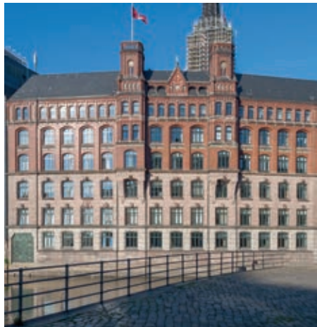
Links oben: Finnlandhaus; links unten: the quality street; oben rechts: ehemaliges Amt für Strom und Hafenbau; unten rechts: Laeiszhof