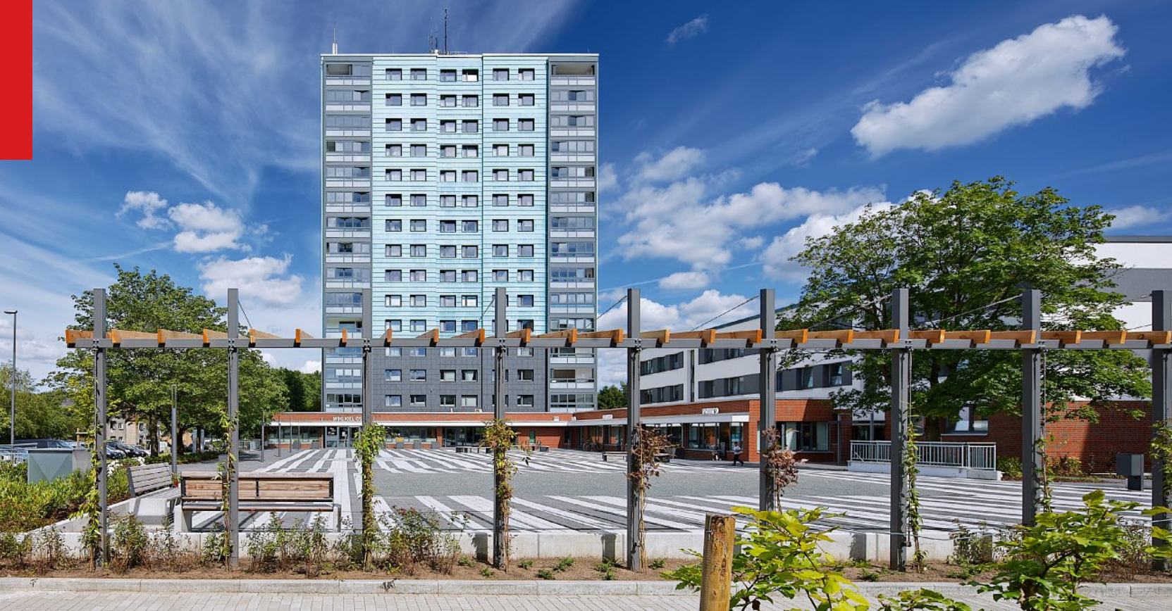
Quartierssanierung Poppenrade, Kiel; AX5 architekten PartGmbH / AX5 ingenieure GmbH; © Bernd Perlbach, Preetz