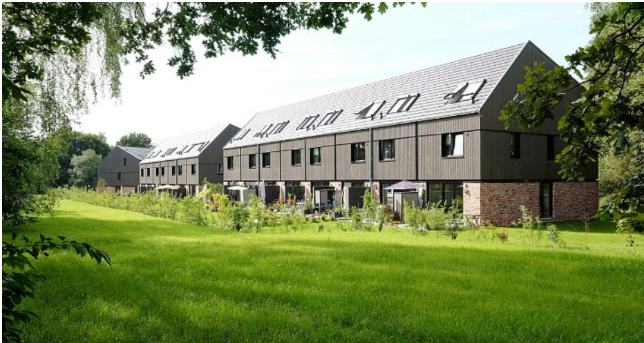
Klimamodellquartier Op´n Hainholt, Hamburg; eins:eins Architekten Hillenkamp & Roselius Partnerschaft mbB; © Carl Christian Müller